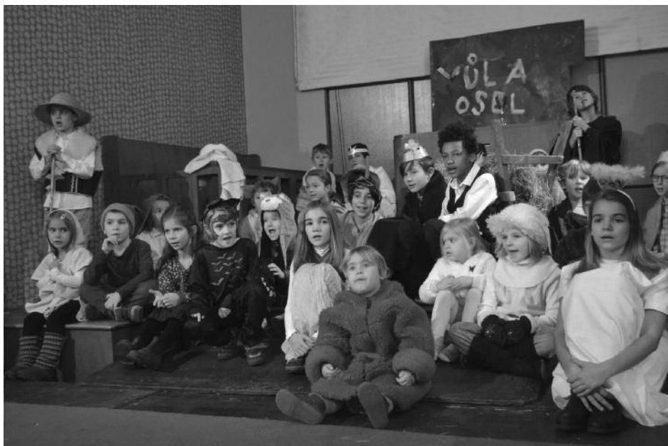
Dětské vánoční divadlo 2019