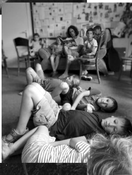
Přífarský tábor v srpnu 2020